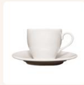
my009-189-193 ゆうりカプチーノカップ &ソーサー