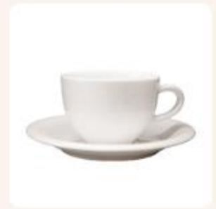
my014-65-63 えふじティーカップ &ソーサー